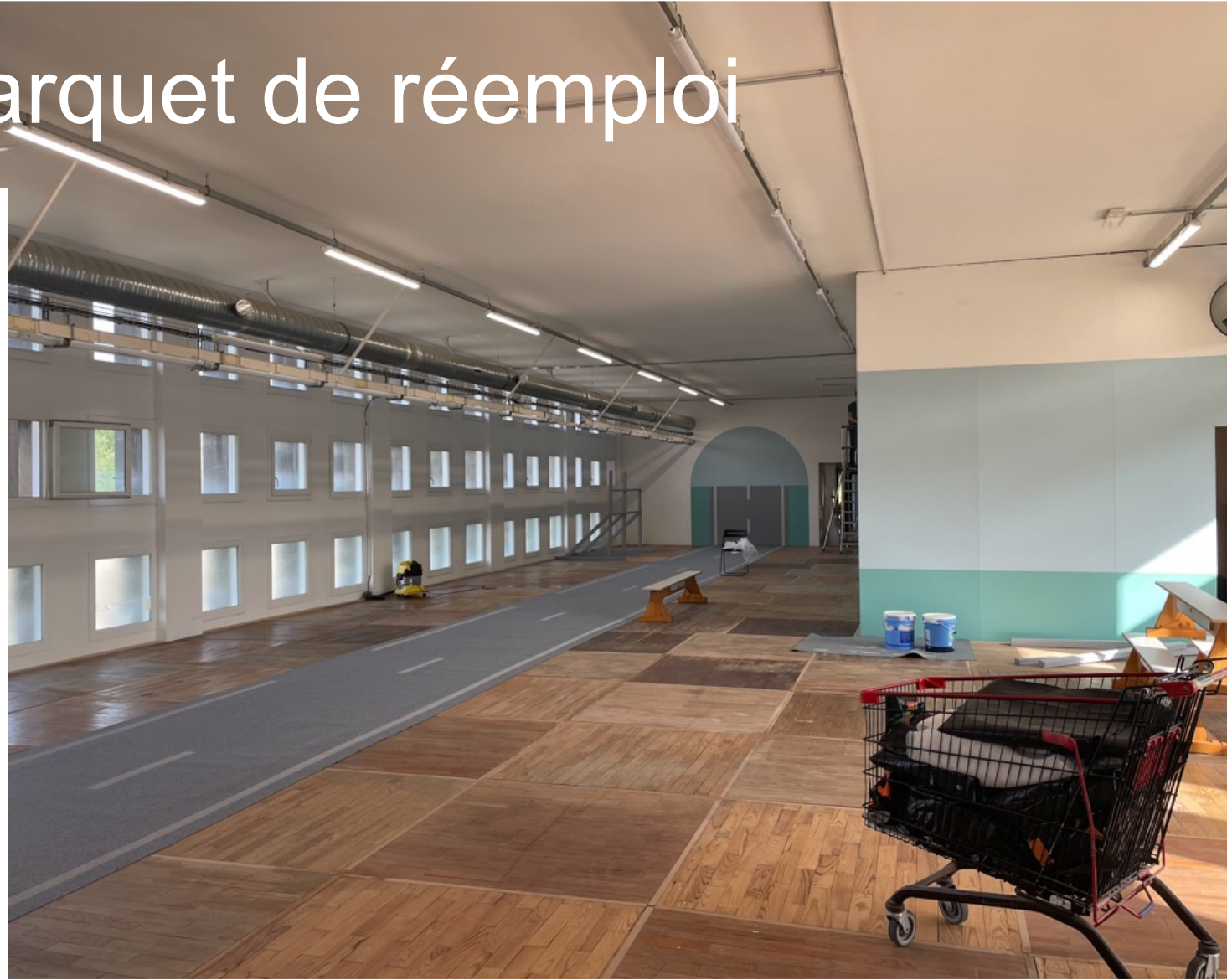
Forum régional du bâtiment durable - 19 mai 2026