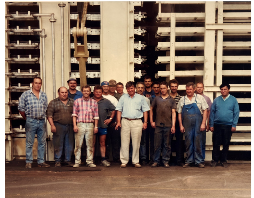
Installation de la nouvelle presse en 2000

De Sutter Frères transforme les anas en panneaux agglomérés : le seul panneau 100% lin fabriqué en France.