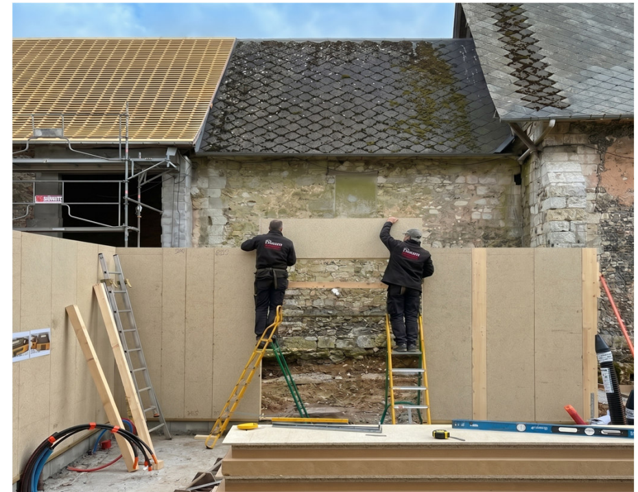
15 m 2 /h à 2 personnes Colisage par façade, livré prêt à monter